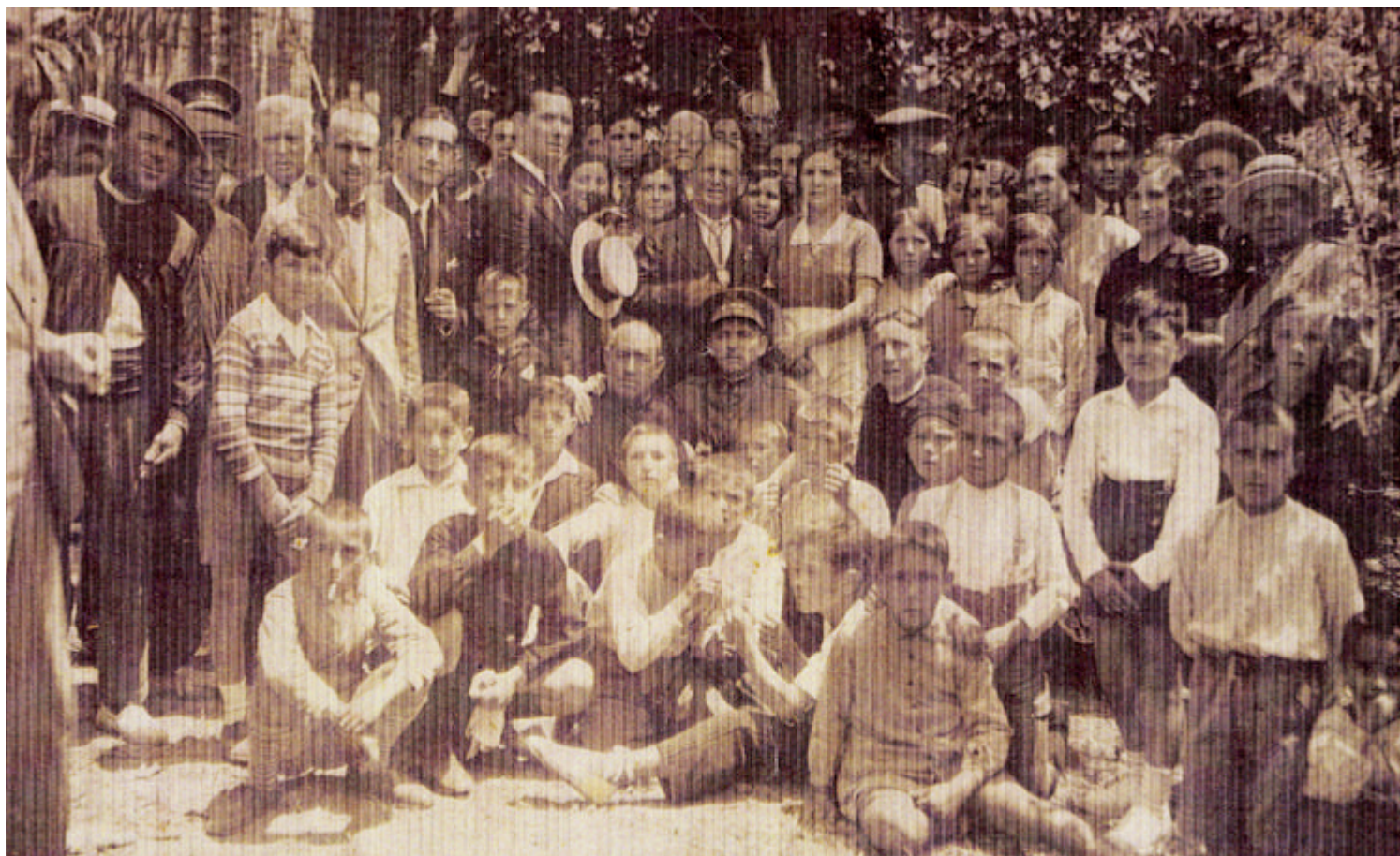
io Francisco lluint una distinció i voltat de les seves dos filles i d'autoritats, a l'ocasió d'un dels nombrosos homenatges que se tributar al llarg de la seua vida